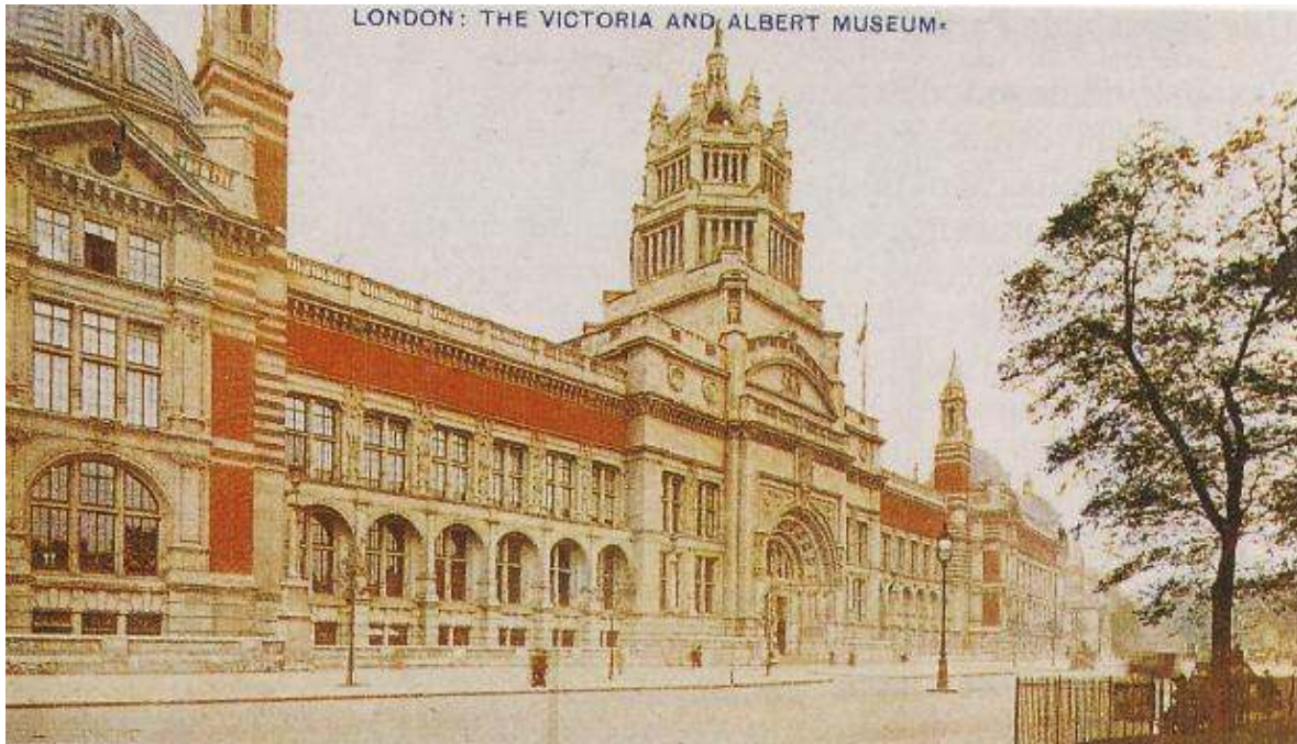
Victoria and Albert Museum

Las exposiciones universales, a partir de la de 1851 en Londres, pondrán la mira en muebles y objetos, creándose los museos de artes decorativas como el South Kensington Museum, que tomó el nombre de Victoria and Albert Museum después de su inauguración definitiva en 1909.