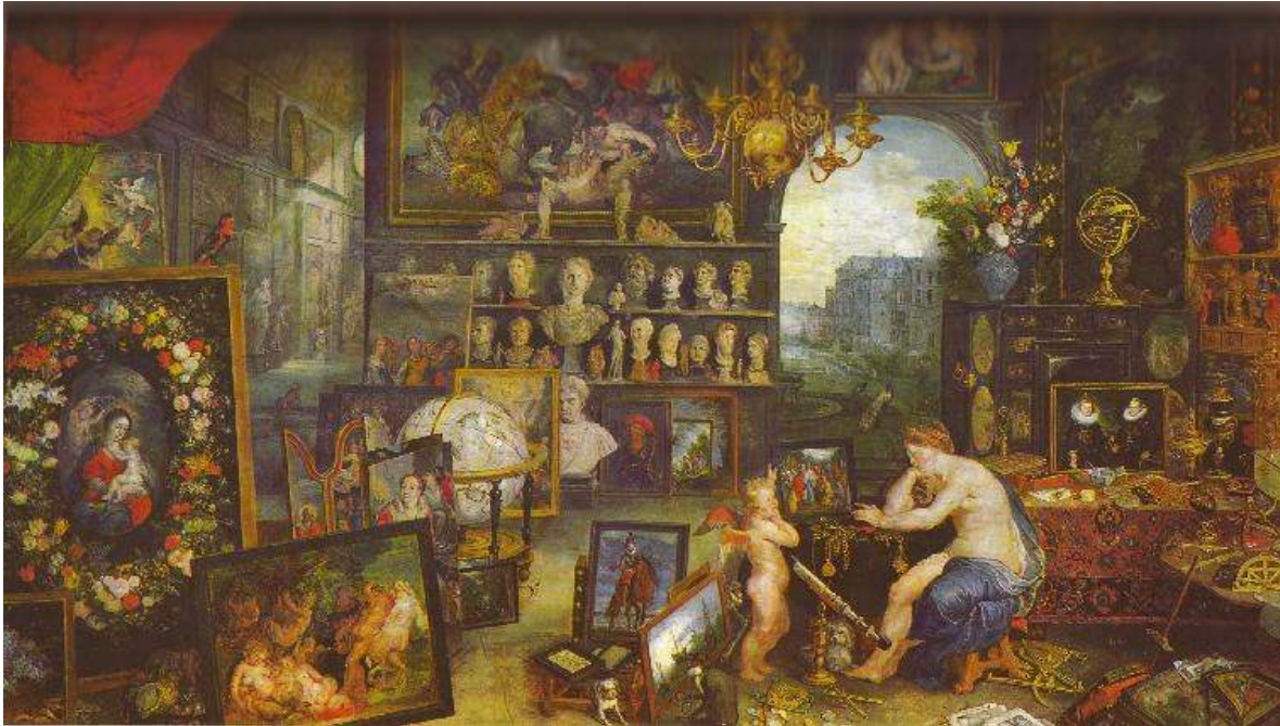
Jan Brueghel "De Velours". La vista (fragmento)

Y esto pasó también a la pintura: en el siglo XVII apareció en Amberes un género pictórico muy singular inaugurado por Frans Franken el Joven (1581-1642) y por Jan Breughel de Velours (1601-1678), y cultivado inmediatamente por numerosos pintores flamencos: la pintura de gabinete, representación a la vez descriptiva y alegórica de los lugares de exposición de las colecciones.